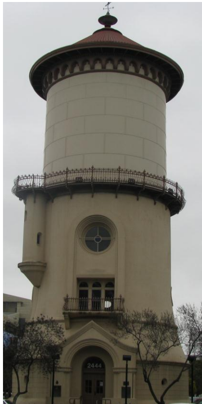
Torre de Agua de Fresno